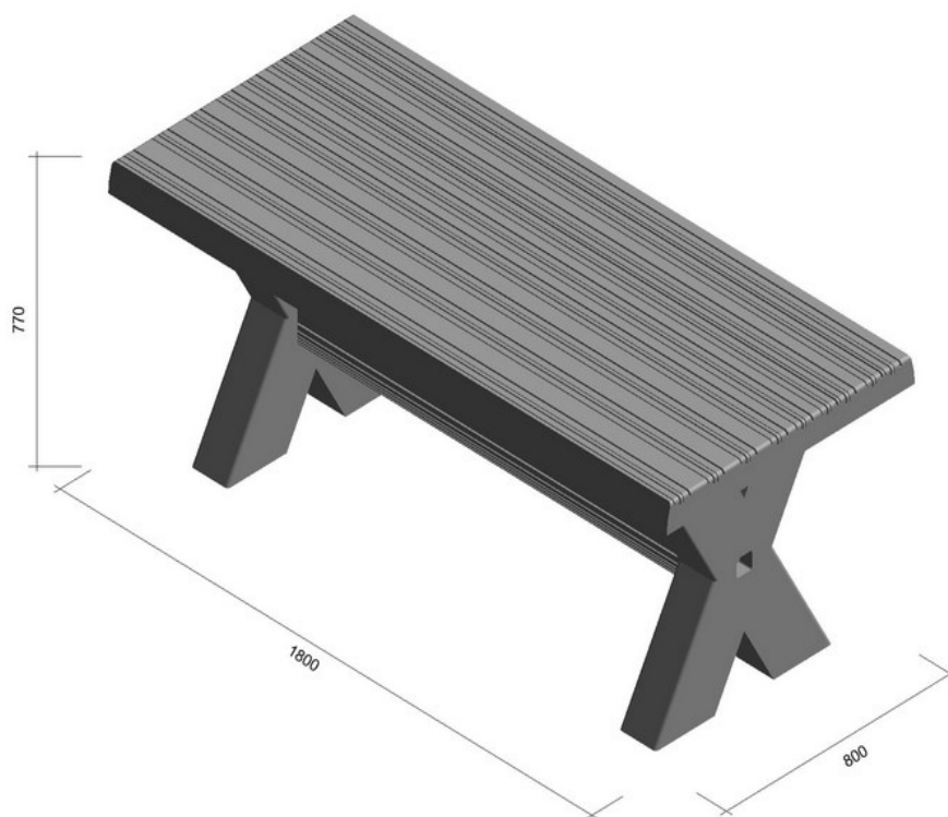
Obr. č. 2 – STŮL I. rozměry